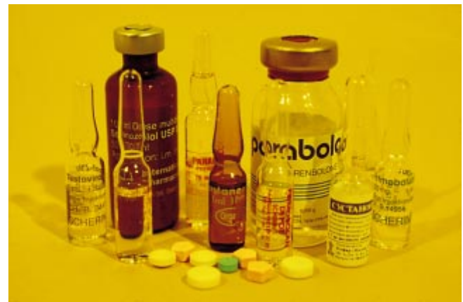
Abb. 1 Verschiedene anabole Steroide vom „Schwarzmarkt“

Zur Erfassung der Situation auf dem deutschen Schwarzmarkt führten wir am Institut für Gerichtsmedizin der Universität Düsseldorf eine Untersuchung von 40 Präparaten durch, die an unterschiedlichen Lokalisationen im Bundesgebiet auf dem sogenannten „Schwarzmarkt“ als anabole Steroide angeboten wurden (Abb. 1).